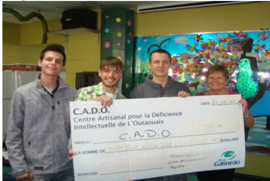
Par : Élisabeth Rollin

DE C.A.D.O. : Le souper-bénéfice qui a été organisé par les étudiants de la Polyvalente Nicolas Gatineau le vendredi 24 avril 2015 à la Légion royale canadienne nous a permis d'amasser un montant de 780$. Merci aux garçons et pour votre participation en grand nombre.