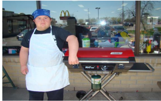
Chef à CADO