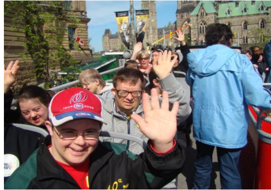
Tour d'autobus «Double Decker»