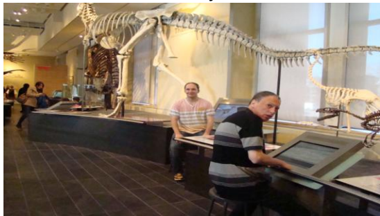
Musée de la Nature